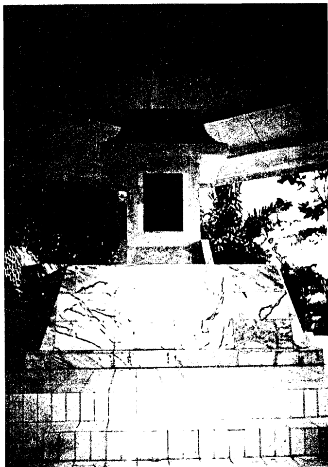
サム・ラトゥランギの墓