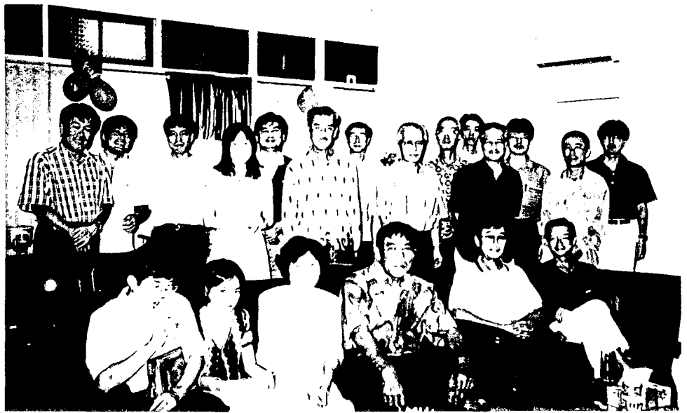
1998年12月27日 忘年会 鹿島宿舎にて