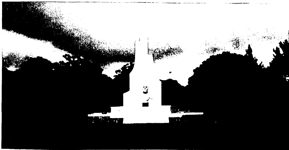
サム・ラトゥランギ記念塔(上)とその拡大部分(下)