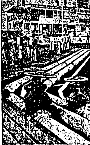
横濱港ニカラタと(上)面市ドナム