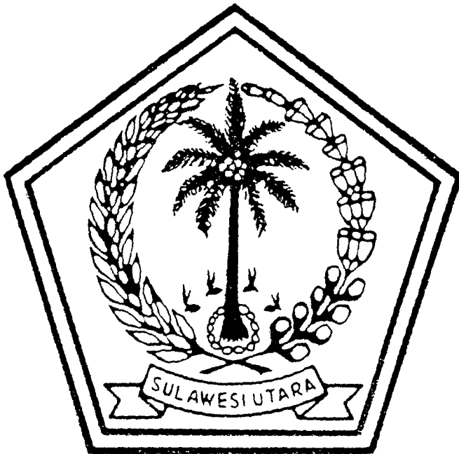
北スラウェシ州の紋章