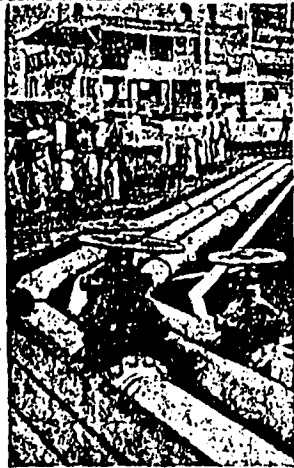
旗幟港ニカラタと(上)面市ドナム