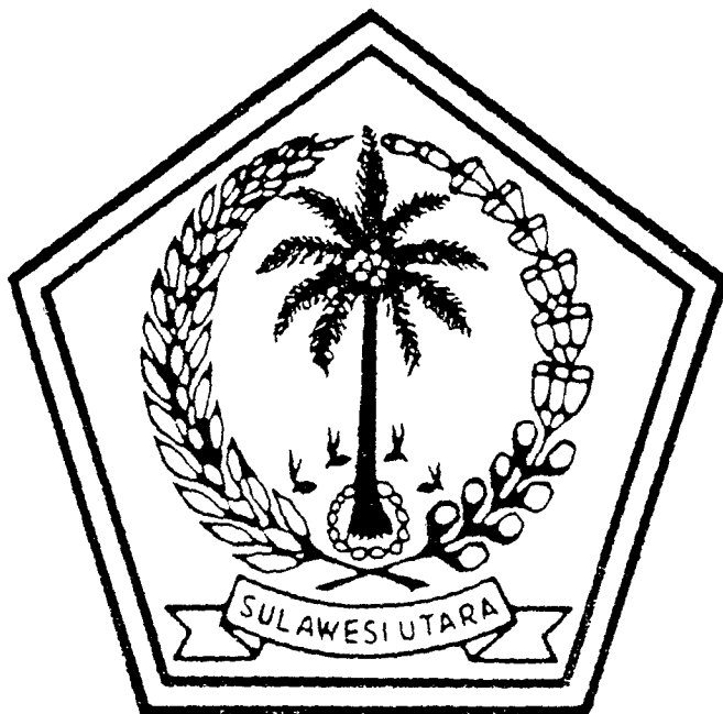
北スラウェシ州の紋章